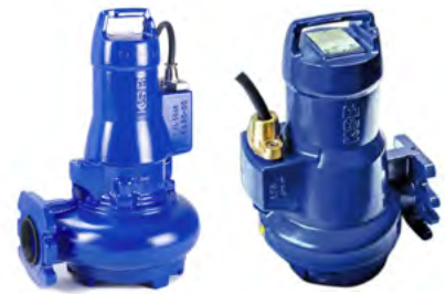
Pompes de relevage